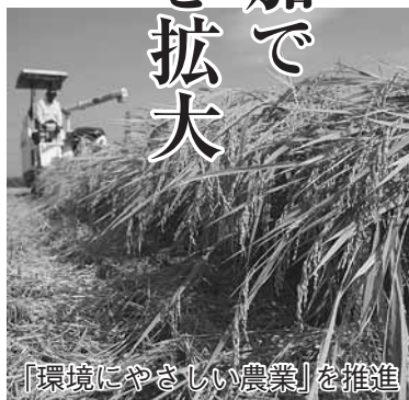
「環境にやさしい農業」を推進

市では、野田産農産物の需要の拡大につなげようと、剪定枝やもみ殻、牛ふんなどを堆肥化し農地に還元する「資源循環型農業」や、米づくりで玄米黒酢散布や冬期湛水など農業や化学肥料を少なくするなど、「環境にやさしい農業」による野田産農産物のブランド化を進めています。