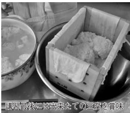
講習最後には出来たての豆腐を賞味

で樺のホール・小ホールで。各日とも先着330人。無料。参加希望者は当日直接会場へ。