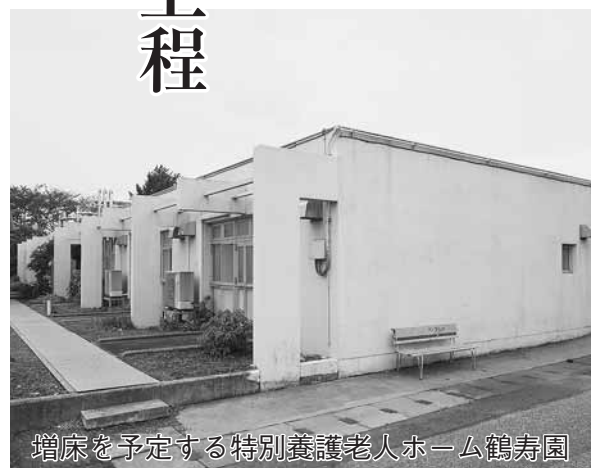
増床を予定する特別養護老人ホーム鶴寿園

身内を装って現金を振り込ませる「振り込め詐欺」は、巧妙な手口で現金を自宅などに持ち帰らせ、その後、犯人が直接受け取りに行く「現金手渡し型」が急増し、市内でも被害や未遂事件が目立ってきています。