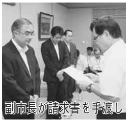
副市長が請求書を手渡し

費として3億5千266万4千587円 を東京電力株式会社請求しま した。請求額は、平成24年度に 市が負担した放射線対策費用の