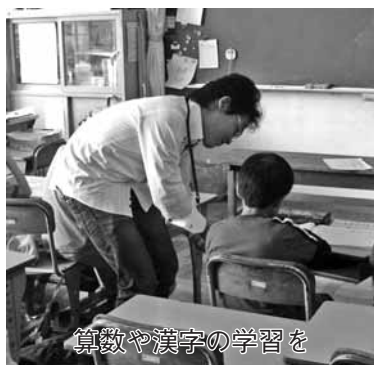
算数や漢字の学習を

市では、学力向上と定着の場として、第2・4・5土曜日に各小学校を会場にして、算数のドリル学習を中心に行う「サタデースクール」を、25年度も開講しています。