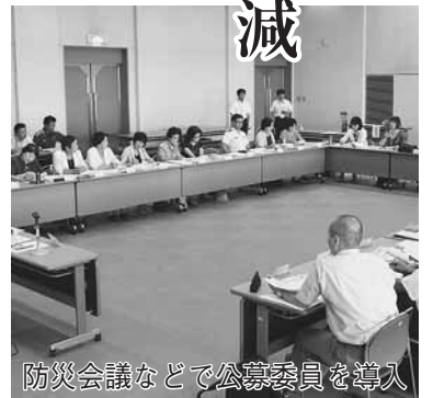
防災会議などで公募委員を導入

市では、「行政改革大綱」と「集中改革プラン」に基づき、財政の健全化とサービスの向上を目指しています。平成24年度は、新たに2施設の指定管理者制度の導入や職員削減などに取り組み、約12・3億円の経費を削減しました。また、審議会などへの公募委員の本格導入など、市民のニーズに合った行政運営やサービスの提供に努めました。