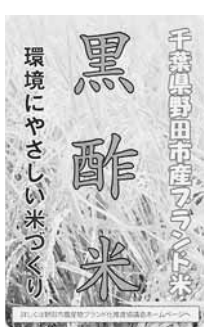
「黒酢米シール」を作成

9か所で試行的に実施しています。冬期湛水は、水をはっておくことで雑草を生えにくくするとともに、微生物の繁殖を促し豊かな土壌作りができる減農薬、減化学肥料の農法です。