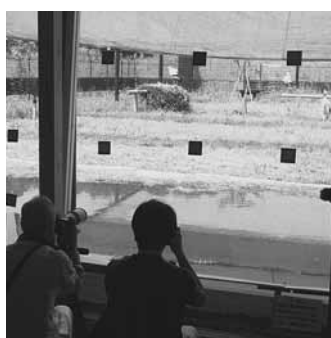
双眼鏡の貸し出しも

とレクチャールームを備え、江川地区での自然環境学習や講習会などにも利用することが出来ます。 また、飼育観察棟では、江川地区に生息する生き物の展示や、全面ガラス張りの観察スペースから公開ケージで飼育されている