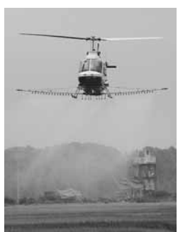
水田に玄米黒酢を散布

◆玄米黒酢農法によるちばエコ米の生産 木野崎や目吹、船形、小山、関宿の5地区約459ヘクタールで空中散布、木間ヶ瀬地区約23ヘクタールで地上散布を行い、玄米黒酢農法の水稲の作付面積は、市内水田のおおよそ半分の約42ヘクタールです。今上地区では、約4ヘクタールの水田で試験散布を行っています。