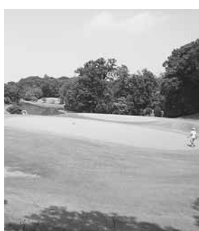
10月から割安な年会費に

26年1月25日に第1回全国将棋サミットを樺のホール・小ホールで開催する予定です。26日には女流名人位戦が開催され、両日で野田市を広くPRします。