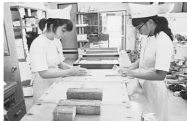
ひとつずつ丁寧に梱包

市内の中学校では、キャリア教育の一環で進路の選択・決定に役立ててもらおうと、2年生を対象に毎年、職場体験を行っている。