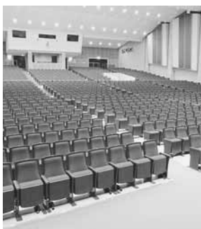
以前より幅広の客席に

◆文化会館の客席改修工事 6月に工事が完成し、7月18日からリニューアルしました。