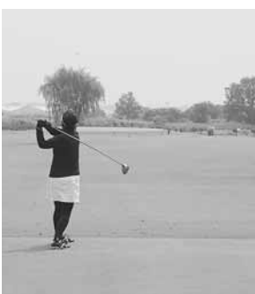
ひばりコースは入場者数増に

ひばりコースで、風呂のシャワールーム化や外壁などの塗装、雨漏り対策、コース内の簡易水洗トイレの設置、乗用カート進入路や置場の整備、指紋認証式