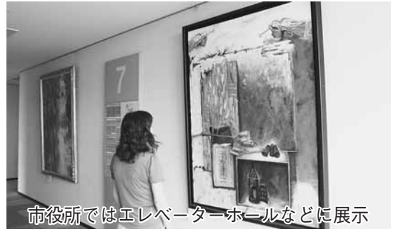
市役所ではエレベーターホールなどに展示

公共施設を訪れる皆さんに美術鑑賞を楽しんでもらおうと、市では、昭和59(1984)年から野田美術会の協力を得て、絵画の展示を行っています。