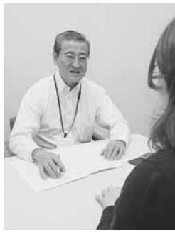
家計の相談にも対応

ル事業 厚生労働省が実施するもので、市では、パーソナルサポートセンターで先行実施し、7月に国のモデル事業に採択されました。経済的困窮や社会的孤立で生活困窮にある方を対象に、相談支援を実施しています。 4月から、自宅等への訪問支援や地域・関係機関とのネットワークを強化し実情の把握や親身な相談で解決を図り、家計改善や管理能力向上等でファイナ