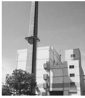
平成26年に稼働停止を予定

26年4月から、都合でごみ集積所にごみを出せない方は、清掃工場やリサイクルセンターへ直接搬入をお願いします。