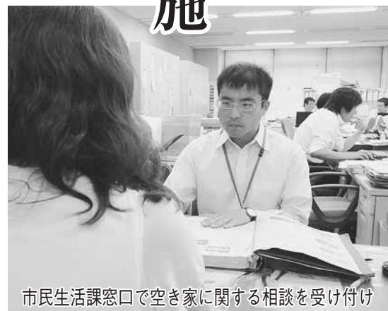
市民生活課窓口で空き家に関する相談を受け付け