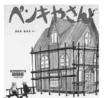
「ペンキやさん」あおきあさみ・さく 福音館書店

あなたの名前には、どんな漢字が使われていますか？この本は名前に多く使われる漢字をランキングで紹介し、それぞれの意味も解説しています。あなたの名前も見つかるかもしれません。