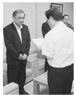
副市長が請求書を手渡し

◆放射能の除染 公共施設は、年1回以上のモニタリングを継続し、現時点で再び市の基準値を超えている施設はありません。私有地は、市民に測定器貸し出しを継続し、市の基準値以上となった3件を除染しました。