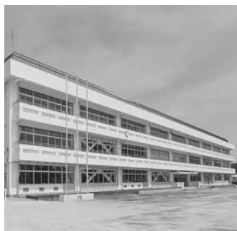
耐震化が完了した東部小学校校舎

体育館3棟は、プレス補強や外装工事を行い工期内完成を目指していますが、宮崎小体育館は、既存の基礎の補強で工期延長が必要となり、学校行事等への影響を最小限にすべく、学校と連携し工事を進めます。