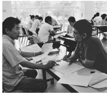
現在は約40人の外国人が受講

平成9年に発足した野田市国際交流協会では、翌10年に市内在住の外国人を対象とした日本語教室を開設しました。当初は日曜コースだけでした