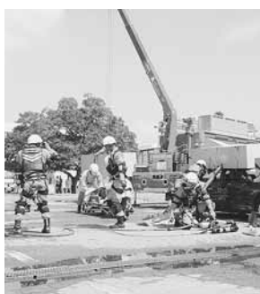
本番さながらの緊張感で

合いただき、住民の安全確認後、リヤカーや徒歩で避難された方を安全な場所に誘導し、自主防災組織の代表者や学校職員、市