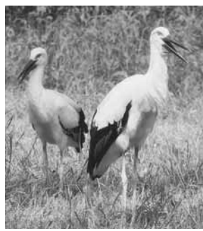
順調に育つ2羽のひな

ノトリは、5月産卵、6月孵化、8月巣立ちと、ひなが順調に成育しています。1羽目が雄で、2羽目が雌と判明しました。一般公開は7月23日から再開し、再開後の来場者数は、8月26日現在千378人です。ひなが元気に巣立ちを迎え、市民に素直に喜んでいただいていることから、自然再生や生物多様性への取り組みに一層の理解が深まり、広がっていくことを期待しています。