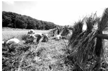
のろし(写真右)に掛かった稲穂

自然再生が進む江川地区の市民農園で、鎌を使って一株ずつ刈り取る昔ながらの稲刈りが、9月1日行われ、23人が参加した。