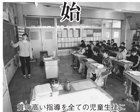
質の高い指導を全ての児童生徒に