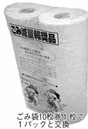
ごみ袋10枚券1枚で 1パックと交換