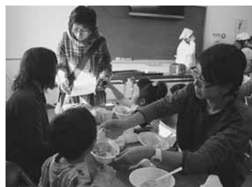
カレーライスは好評でおかわりする人も

開設するのの前に、子どもたちに体験してもらおうフェアを七光台会館で開催した。賛同者からは食材も寄附されており、実行委員会は正式開設後の利用を呼び掛けている。