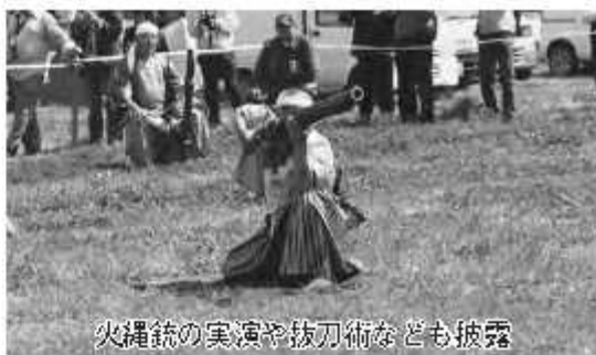
火縄銃の実演や抜刀術なども披露

関宿の歴史や文化を伝えようと平成8年に始まった「関宿城まつり」と、植樹した桜の成長を願い、20年に始まった「関宿城さくらまつり」は毎年同時開催してきましたが、今年から「関宿城さくらまつり」に名称を統一し、4月8日(日)9時30分から15時30分まで関宿城博物館周辺で開催されます。