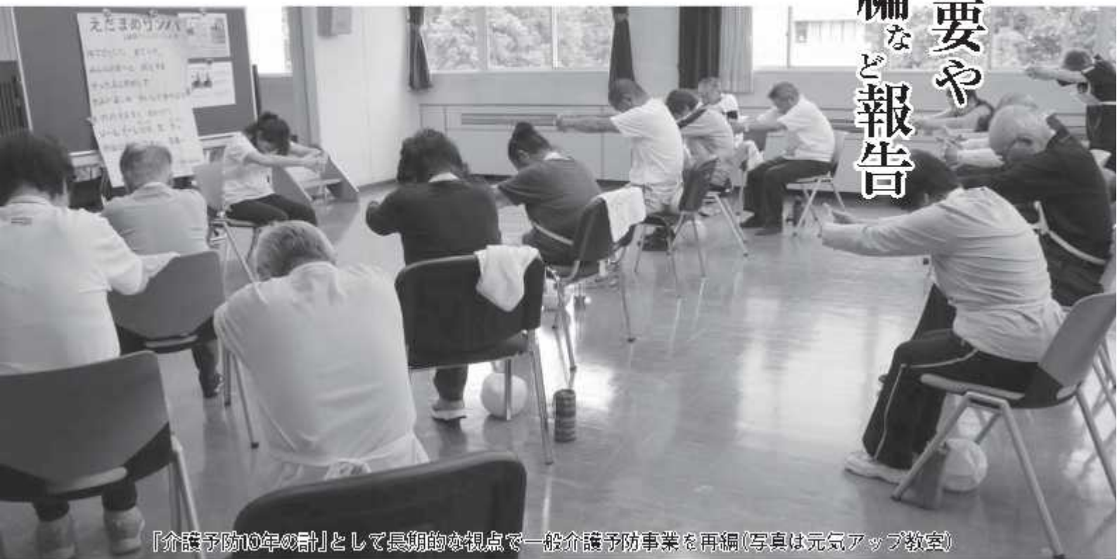
「介護予防10年の計」として長期的な視点で一般介護予防事業を再編(写真は元気アップ教室)