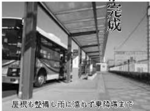
屋根も整備し雨に濡れず乗降場まで

川間駅北口駅前広場は、平成26年度から整備を開始し、昨年の12月に、概成した箇所から供用を開始していましたが、その後、広場内の植栽、交通標識などの工事を実施し、29年3月31日に完成しました。駅前広場はバリアフリーに対応し、身体障がい者用の乗降場の設置や歩道を設けるな