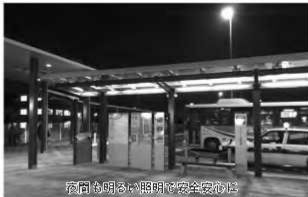
夜間も明るい照明で安全安心は