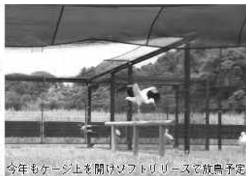
今年もケージ上を開けソフトリリースで放鳥予定

また、来年度のコウノトリの試験放鳥は、各施設のコウノトリの産卵時期や血統も考慮し、I P P M - O W S (コウノトリの個体群管理に関する機関・施設間パネル)の計画に沿って、他の施設から譲り受けた有精卵を親鳥に托卵し、ふ化したヒナを放鳥個体とし、昨年同様、ソフトリリースによる試験放鳥を計画しています。地元への定着の可能性を考慮し、巣立ち直後に放鳥する予定です。 なお、野生復帰を踏まえ、コ