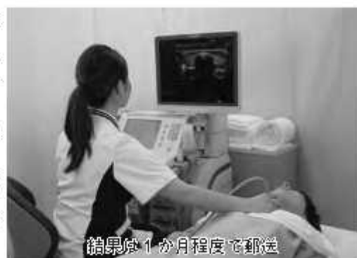
矯正歯1か月程度で郵送