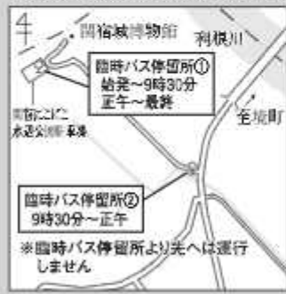
■臨時バス停留所の位置図

※イベントが悪天候などで中止の場合でも臨時便は運行します(臨時バス停は設置しません)【問合せ】企画調整課