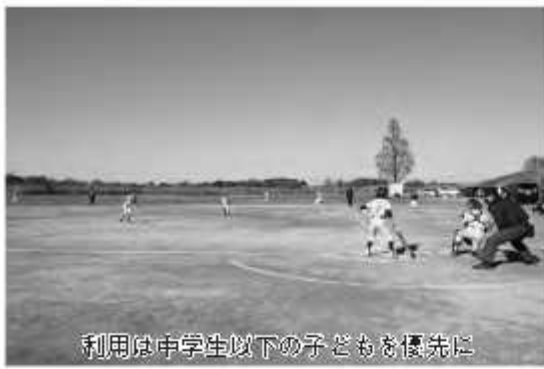
利用は中学生以下の子どもを優先に

め、総合公園では、庭球場、芝生広場、野球場を対象に、関宿総合公園では、グラウンド・ゴルフ場、フットサル場、ゲートボール場と関宿少年野球場を対象に、7月と8月の2か月間、休館日と大会使用で支障のある日を除き、7時から早朝開場を実施します。