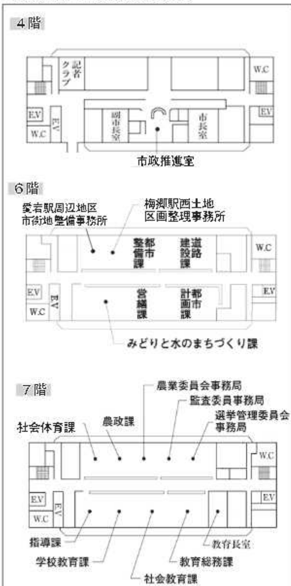
■市役所本庁舎内の移転後の配置図

そこで、重要施策の推進を始め、部局横断的なさまざまな施策に対し、これまで以上にスピード感をもって対応するため、新たに市長直轄の組織として市