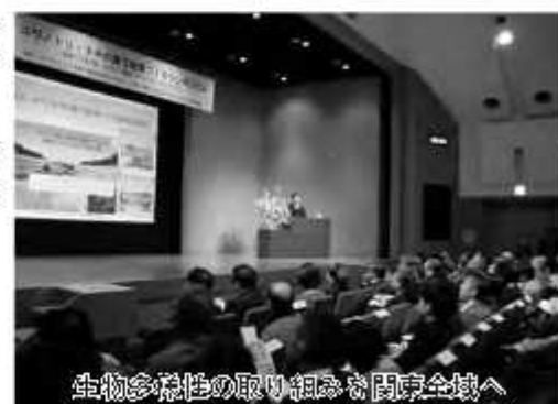
生物多様性の取り組みも関東全域へ