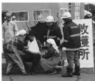
迅速な対応に向け防災訓練も