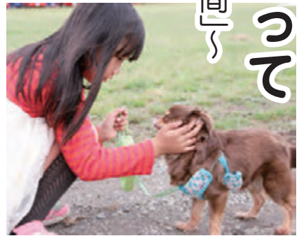
正しい飼育方法の講座の利用も