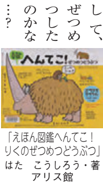
「えほん図鑑へんてこ! りくのぜつめつどうぶつはたこうしろうアリス館」

95歳、写真家の著者は、世界各地で行われる祭礼の撮影をライフワークとしています。北欧やアジア、南米など、東西を問わず、人々が神々に願い、感謝する姿が焼き付けられた作品から見えてくるものは。