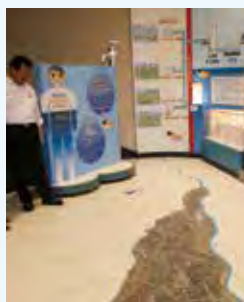
水道水の届くまでの過程を紹介

【申込みと問合せ】6月29日（日）必着で往復はがきに参加者全員（1枚で2人まで）の住所・氏名・年齢・☎・集合場所・参加希望人数・市報への意見を明記し、〒278・8550 野田市役所広報聴課「公共施設等見学会」係へ 【HP検索】1010613