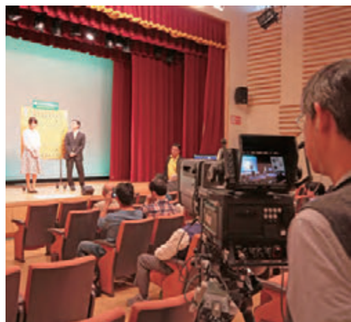
NHKの撮影やプロ棋士による大盤解説も

プロ棋士の登竜門として知られる小学生将棋名人戦。今年の準決勝、決勝の対局は、野田市（関根名人記念館対局室）で開催された。主催者の日本将棋連盟によると、現在将棋界のトップで活躍する渡辺明竜王や羽生善治三冠も過去に同大会で優勝とのこと。今年の予選には過去最多の3千人以上の選手が参加するなど、将棋人気が高い模様だ。