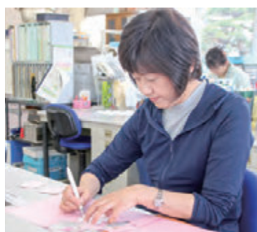
学校担任の負担軽減へ

ル地域に選ばれ、「小学校学級事務支援員」の配置事業が実践研究の対象事業となりました。対象事業は、文科科学省から委託費が支給されるほか、その成果が全国の学校現場に先進事例として発信されます。