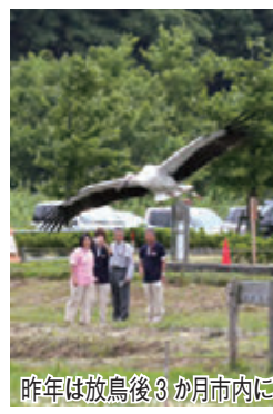
昨年放鳥後3か月市内に

自然再生や生物多様性への取り組みを進める市は、そのシンボルとして、コウノトリを平成24年から飼育し、2年前から試