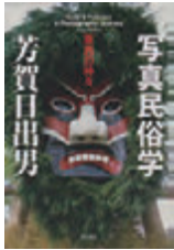
「写真民俗学〜東西の神々〜」 芳賀 日出男・著 KADOKAWA

興風図書館 ☎ 7123-7611 南図書館 ☎ 7125-7981 北図書館 ☎ 7129-8811 せきやど図書館 ☎ 7198-4946