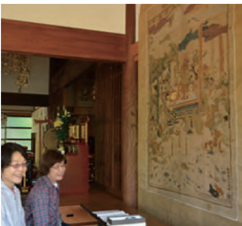
図中や総縁には刺繍で2,000人程の名前などが

清泰寺（東金野井）は5月8日、所蔵する県指定文化財の掛け軸「刺繍釈迦涅槃図」を一般公開した。掛け軸は、約350年前の江戸時代初期に制作され、人物や動物を華麗な刺繍で表現している。当日は市内外から約70人が見学に訪れ、皆熱心に見入っていた。初めて見たという女性は「まるで絵画のようでした」と驚いていた。