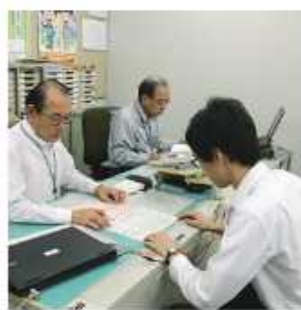
就労支援のノウハウを持つ相談員