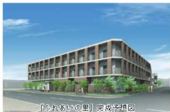
「ふれあいの里」完成予想図

入所待機者の解消に向けて、特別養護老人ホーム「ふれあいの里」が4月に開設します。愛宕駅近くの立地に、ショートステイのほか、宿泊もできるデイサービスや地域の交流スペースも併設する施設で、入所申込みを開始しています。