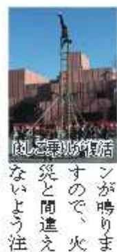
消防出初式 「野田の観光写真展」を開催します。