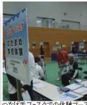
つなげ手フェスタでの体験ブース

市では、「介護予防10年の計」の6つの戦略の1つとして、介護予防に関わる知識と技術の普及啓発により、市民自らが介護予防に取り組むための動機付けとなることを目的に、1月11日(困)から保健センター4階で「のだまめ学校」を開校します。