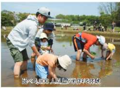
延べ4,000人以上が米作りに体験

【料金と米の配布】「ファミリリー型」は4千500円。中学生以下2千500円。3歳以下は無料。「オーナー型」は1区画3万円（1人追加ごとに千円増）。「ファミリリー型」は1区画あたり玄米5キログラム（中学生以下は3キログラム）、「オーナー型」は1区画玄米60キログラム