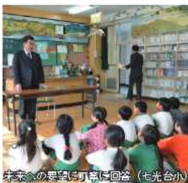
市長への要望に丁寧に回答 (七光台小)

◆市長と話す集会 小中学生アンケートを踏まえ、10月から各小中学校を訪問し、「市長に会いたい、話してみたい」と希望する児童生徒と直接意見交換を行いました。印象に残ったことを幾つか申し上げますと、野田の良さとして、自然が多いところと感