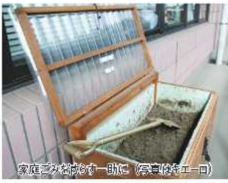
家庭ごみを減らす一助に（写真貸付キエーロ）

平成28年度から、生ごみ堆肥化装置「キエーロ」も助成の対象になりました。 ※キエーロとは、土に含まれる微生物により、生ごみを消滅させる