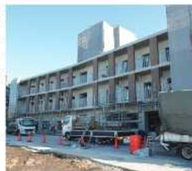
鉄筋コンクリート造で建築29年12月竣工

専門の相談員による求人・求職の相談やあっせんに加え、市内企業の求人情報やハローワーク野田の求人情報を自由に閲覧することができま