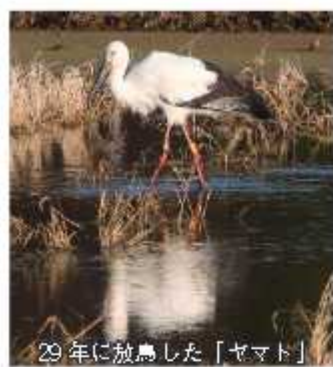
29年に放鳥した「ヤマト」

げますが、初年度は授業への理解の差が目立ってくる3年生を対象にしたいと考えています。