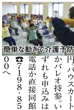
防犯指導で動き簡単な 00へ

◆安眠ヨガ教室 4月9日～6月4日(4月30日を除く)の日(日)19時30分～20時50分総合公園体育館で。全8回。高校生以上。先着35人。2千500円。申込みは3月19日(日)～4月8日(日)(火除く)に直接同館窓口 ☎7125-1155へ