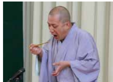
扇子がまるで箏やキセルのよう

校に勤務している縁で実現。大半が落語を未体験という生徒に「竹の水仙」を披露した一之輔師匠は笑いやまない様子を見て、「次はぜひ寄席に来てほしい」と語った。