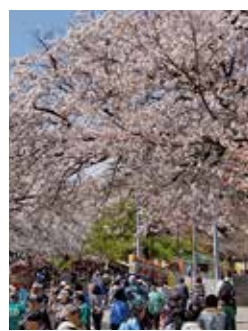
日本さくら名所100選に選出