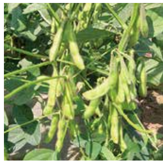
国内有数の産地で収穫を

【対象】収穫に来られる方 【収穫時期・量】7月上旬～中旬、1区画で30グラム入り袋13袋分 【価格】1区画3千円 【申込み】3月30日(金)必着で往復はがきに郵便番号、住所、氏名、電話番号、希望区画数、連絡の取りやすい時間帯、「えだまめオーナー希望」と明記し、〒278・8550 野田市役所農政課へ(多数の場合は抽選) 【HP検索】1015682