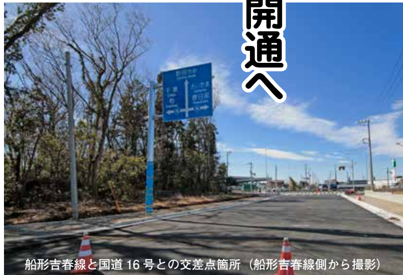
船形吉春線と国道16号との交差点箇所 (船形吉春線側から撮影)

の東武野田線(アーバンパークライン)の川間駅へのアクセスも向上します。現在、早期の完成に向けて整備を進めており、道路の供用開始は4月中旬の予定です。