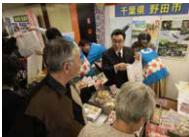
市長も店頭販売し「野田」をセールス

野田の魅力をPRしようと、野田市観光協会では、会場に訪れた約2千200人の顧客に推奨物産品やコウノトリグッズなどを販売し、大盛況だった。※テレビ放送は3月18日NHKテレビで