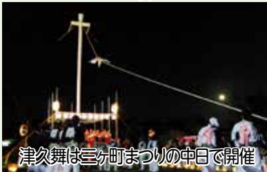
津久舞は三分町まつりの中日で開催

Fenolosa-Weld collection, 11.4591