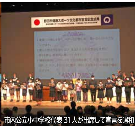
市内公立小中学校代表 31人が出席して宣言を唱和