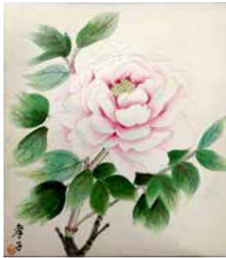
ボタンは中国原産で奈良時代に日本に渡来