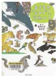
「生きもの【なんで?】行動ノート」 きのした ちひろ・絵・文 SBクリエイティブ

興風図書館 ☎7123-7611 南図書館 ☎7125-7981 北図書館 ☎7129-8811 せきやど図書館 ☎7198-4946