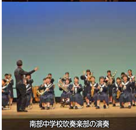
南部中学校吹奏楽部の演奏