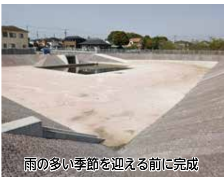
雨の多い季節を迎える前に完成

また、自転車乗車中の交通事故で亡くなった方の7割は、頭部に致命傷を負っていることから、市では、自転車事故による被害を軽減していくこと、ヘルメット着用を後押しする購入助成のための1万人分の予算案を、5月12日の臨時議会に提出し、可決いただきました。 助成対象は、令和5年4月1日以降に、自転車乗車用ヘルメットのうち、SG（一般財団法人製品安全協会）やJCF（公益財団法人日本自転車競技連盟）など5団体のいずれかの安全基準を満たしているヘルメットを購入した市民です。