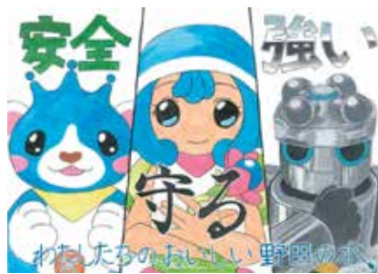
「水道水 安心・安全 これからも」がスローガン

6月1日から7日までは水道週間です。水道部では、野田市の安全で安心なおいしい水道水をアピールしようと、昨年開催した水道ポスター展の受賞作品を市役所やいちいのホール、小中学校などに掲示します。詳細は、水道部ホームページで確認してください。