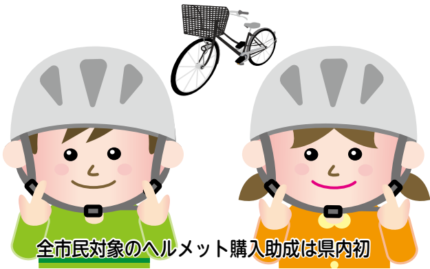
全市民対象のヘルメット購入助成は県内初

【問合せ】関宿パークMOPS（関宿総合公園）体育館 ☎047-198-8500 【HP番号】10379994