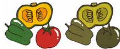
色覚が人によって異なる

色に対する感じ方(色覚)は、味覚や嗅覚などと同じように人それぞれに違います。そのためちよつとした配慮が足らず、情報が正確に伝わらないことがあります。 そこで、なるべく全てのの人に情報が正確に伝わるように、利用者の視点に立って色の使い方などに配慮する「カラーユニバーサルデザイン(略称CUID)」が推奨されています。 市では、市役所庁舎正面玄関にある掲示板や市民課窓口の番号札発券機、番号呼び出し表示