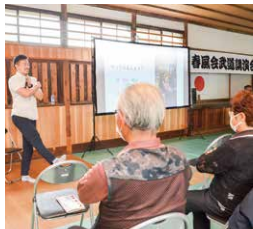
ひざ関節や肩甲骨のストレッチなどの実践指導も

NPO法人野田春風会は5月14日、けがを予防し、豊かなスポーツライフを送ってもらうと、武道講演会を春風館道場で開催した。 講師の国立スポーツ科学センター職員は、関節の鍛え方や良い姿勢、利き目、睡眠サイクルなどのテーマを語り、「情報に振り回されず、知識を身につけて自分の体に最も適した練習を」と結んだ。