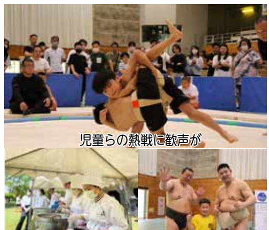
児童らの熱戦に歓声が