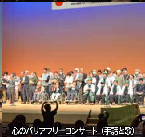
心のバリアフリーコンサート（手話と歌）