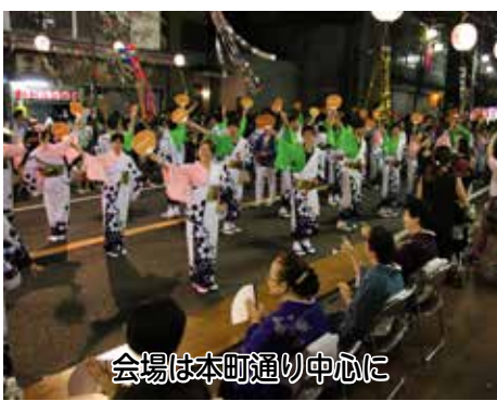
会場は本町通り中心に

「野田七々まつり」は、市制施行の頃に始まり、「おどりパレード」は昭和47年から開始し