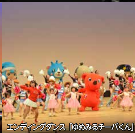
エンディングダンス「ゆめみるチーパくん」