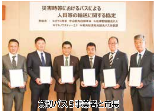
貸切バス5事業者と市長

社マルノウチディーエス、株式会社和光輸送和光観光バス事業部)と、災害時等のバスによる輸送に関する協定を締結しました。本協定により、バスを利用し