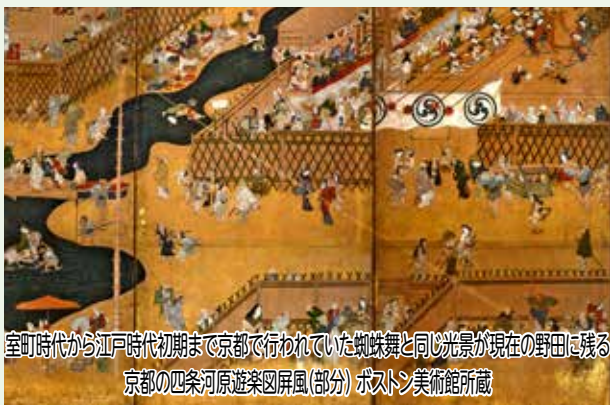
室町時代から江戸時代初期まで京都で行われていた蜘蛛舞と同じ光景が現在の野田に残る 京都の四条河原遊樂図屏風(部分) ポストン美術館所蔵

たくさんの先人たちの情熱と努力と現在に生きる地域の人たちの熱い思いで続いてきている津久舞は、平成5(1993)年に県の『無形民俗文化財』、平成11年に国の『選択無形民俗文化財』に指定され、今年『ちば文化資産』に選定されました。今年の津久舞の開催は7月15日 田です。 【問合せ】 PR推進室☎7199-2090 【参考文献】 野田市郷土博物館『野田の夏祭り』と津久舞、宮崎等『龍ヶ崎史研究第8号』、齊藤芳太郎『津久舞復活譚』月刊とも24・25号、愛宕睦会のお祭り野郎たち『帰ってきた津久舞』月刊とも13号