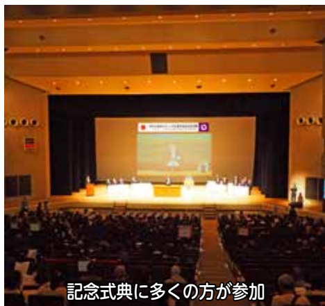
記念式典に多くの方が参加

「HP検索」の番号を市ホームページ右上にある「サイト内検索」のボックスに入力し検索すると、関連記事をすばやくご覧いただけます