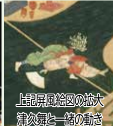
上記屏風絵図の拡大 津久舞と一緒に動き