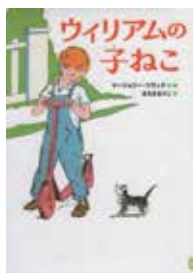
「ウィリアムの子ねこ」 マージョリー・フラック・作・絵 マーゴ・マズダキ・訳 徳間書店

「不思議」「なぜ」と感じる生き物たちの行動や生態。その謎を解明すべく研究を重ねる研究者たち。研究の積み重ねでわかった驚きの発見をわかりやすくイラストで解説した1冊です。