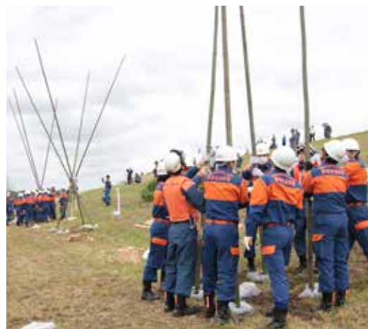
地域の人に見守られながら五徳縫い演習

5月14日、岩名地先の江戸川左岸にある江戸川河川敷運動広場で水防演習を実施した。 市内の消防団員や消防署員など総勢455名が参加し、演習は流速を緩和する木流し工法や堤防の亀裂拡大を防ぐ五徳縫いなどが行われた。参加者は「最近地震が多く不安だけでなく、災害を想定した実践的な訓練で備えるのが大切だね」と話していた。