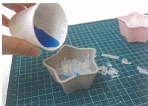
④ 水に溶かした食紅をまんべんなくそそぎこむ。