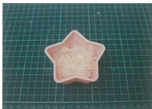
③ 耐熱容器に移し替えます。