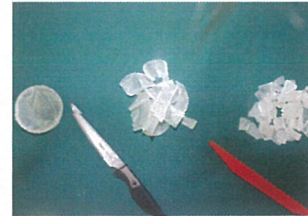
② 透明のグリセリンソープを細かくカットする。グリセリンソープは固いため、先に薄くカットしておくとお子さんでも簡単に切れますよ。