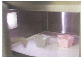
⑤ 泡が溢れないようにレンジで10秒ずつ様子を見ながら温めていく。