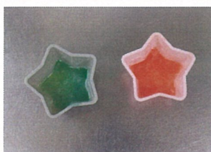
⑥ レンジから取り出して固まるのを待つ。