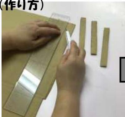
① 段ボールを1.5センチ幅でペットボトルの大きさに合わせて切る