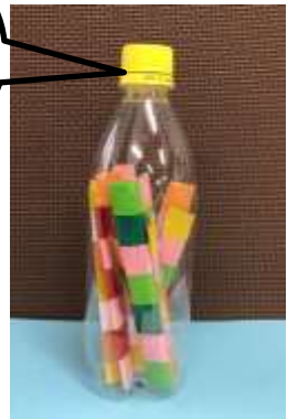
③ キャップは取り外しておきます。ペットボトルに入れたり、出したりして遊びます。