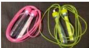
① 100円ショップのなわとびの持ち手を取ります ペットボトルのキャップに穴を開けます