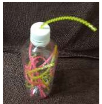
③ 穴を開けたキャップをはめておきます。段ボールのスティック棒よりも難易度があり、より集中して遊べます。

ものをつまむ、穴に入れる、落とすなど指先を使うことで、発達を促すねらいがあります。繰り返し遊ぶことで集中力も養われます。