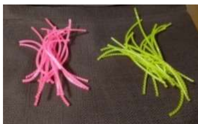
② ペットボトルの高さに合わせた長さに切ります。