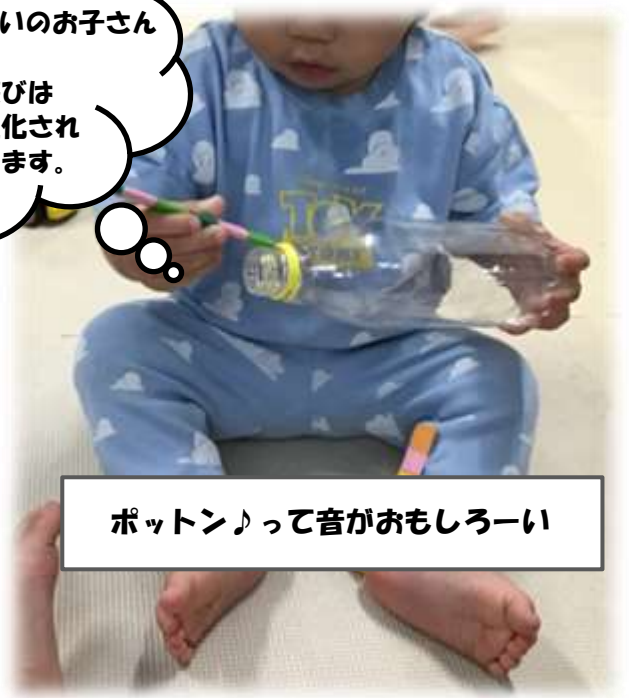
ポットン♪って音がおもしろーい

0歳～2歳くらいのお子さんにピッタリ！ 指先を使った遊びは脳の働きを活性化されるといわれています。