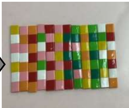
② 好きな色のビニールテープ(7センチ位に切ったもの)を巻いて段ボールのスティック棒を作ります