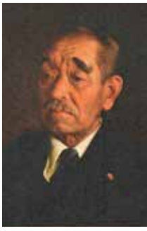
貫太郎翁の肖像画