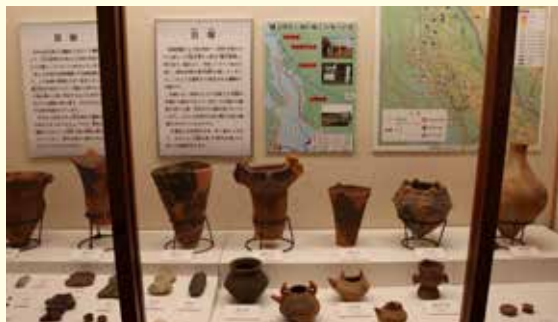
新しく設置した考古遺物のコーナー

るコーナーも、醤油醸造家の本印が入った「掛看板」を新たに展示物に加えるなど充実した展示となっています。