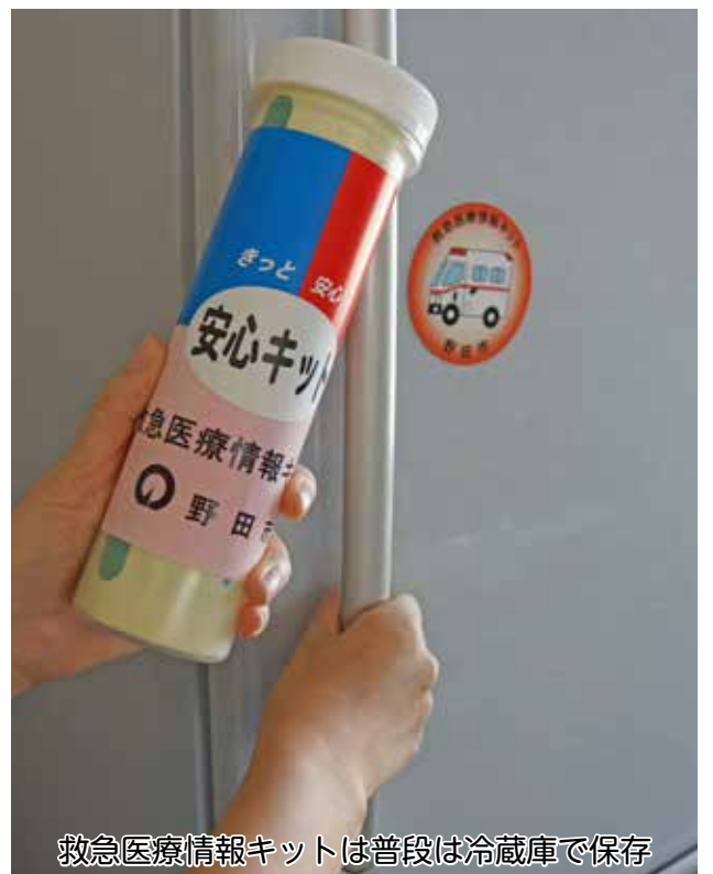
救急医療情報キットは普段は冷蔵庫で保存

【問合せ】水道部工務課 ☎07124・5146 【HP検索】①は1028336、②は10288353