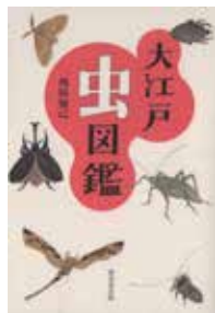
「大江戸虫図鑑」 西田知己・著 東京堂出版

興風図書館 ☎ 7123-7611 南図書館 ☎ 7125-7981 北図書館 ☎ 7129-8811 せきやど図書館 ☎ 7198-4946