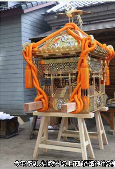
今年修復したばかりの上花輪香取神社の神輿

今年6月18日、上花輪香取神社の神輿が約8か月の修復作業を終えました。大正14(1925)年製作の神輿は里次則壯のほか6人の大工と、飾りや彫物の職人らが腕を振るったことがわかっています。中でも彫物師の石川信