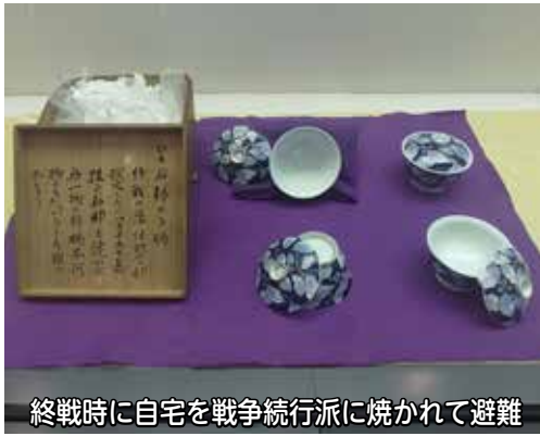
終戦時に自宅を戦争続行派に焼かれて避難