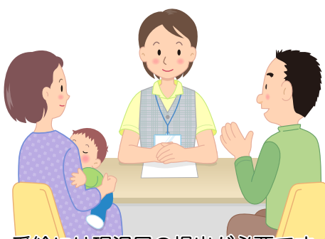
受給には現況届の提出が必要です

【問合せ】 障がい者支援課 ☎ 7199・3732 【HP検索】 特別児童扶養手当は1000401、特別障害者手当は1000402、障害児福祉手当は1000403