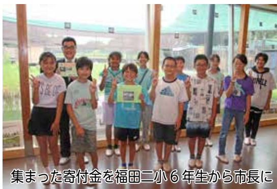
集まった寄付金を福田二小6年生から市長に

217人が指導士になり、各地域で活動しています。 【日時】9月7日(日)、11日(日)、14日(日)、20日(日)、22日(日)、27日(日)の9時～15時 【場所】保健センター 【対象】全日程に出席し、指導士会に入会後、ボランティア活動を行える方 【定員】先着20人 【申込み】8月7日(日)～16日(日)に電話か直接、高齢者支援課 ☎④ 7123・1092(平日8時30分～17時15分)へ 【HP検索】1011210