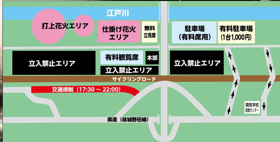
■会場マップ（会場レイアウトが例年と違います）

■有料観覧席を販売中（会場近くの専用駐車場・専用バー・専用トイレ付き） 大迫力の全長240メートルの仕掛け花火を真正面から体感できる観覧席です。 【料金】5人席＝20,000円（テーブル指定席）、4人席＝16,000円（シート指定席）、 1人席＝4,500円（シート自由席）、カメラ1人席＝4,500円（カメラ席のみ三脚可） 【購入方法】①全国のファミリーマートに設置の発券機ファミポートで購入か、 ②販売サイト「イープラス」で会員登録し予約後コンビニエンスストアで支払い