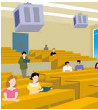
市民講座の第9回目は、杉山

さらに、市民を対象にした、大学主催の市民講座を野田市と流山市との3者で締結した包括連携協定に基づき、定期的に開催しています。