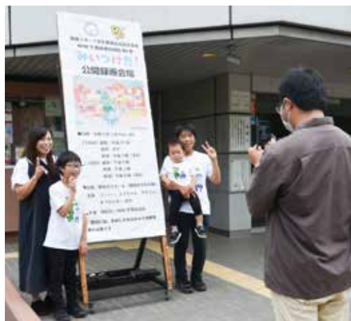
「収録で野田の名産を知ったのでまた来たい」と話す人も

市では健康スポーツ文化都市宣言記念事業として7月9日、開局80年を迎えるNHK千葉放送局と共催で、Eテレの人気番組「みいつけた！」の公開収録を野田ガスホール（文化会館）で開催した。収録の様子は、8月20日（月）16時15分から放送予定。8月14日（日）7時30分（再放送18時25分）からは、野田市などの「千葉スペシャルウィーク」も。