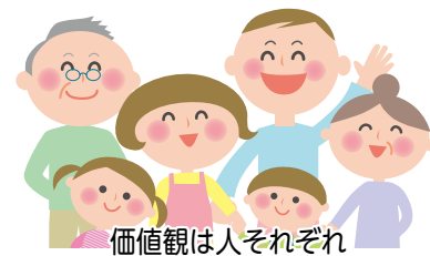
価値観は人それぞれ

夏は、旅行や帰省などで、いろいろな地域やたくさんの人に出会う機会が増えると思います。地域によっては、自分と違う言葉(方言)や行動、慣習などがあります。その時、あなたは どう思いますか。 自分の考えと違うことを見たり聞いたりして、差別的な態度や発言をしてしまったことはありませんか。 差別問題は、差別をする人がいるから起きるのです。 差別をなくすには、自分の中にある差別や偏見と向き合う必要がある。