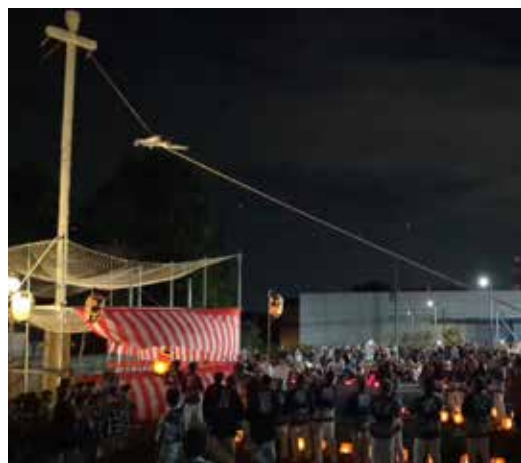
多くの方が見守る中で命綱なしの演舞

7月15日の夜、キッチンマン駐車場で、津久舞が行われた。津久舞は、享和2(1802)年に干ばつで大凶作になったことから、野田町と山崎村で臨時で行われた記録が残る、古くからの雨乞いの行事で、国選択・県指定の無形民俗文化財。 今年は、豊かな文化の魅力特徴づけるものとして、ちば文化資産にも選定されている。