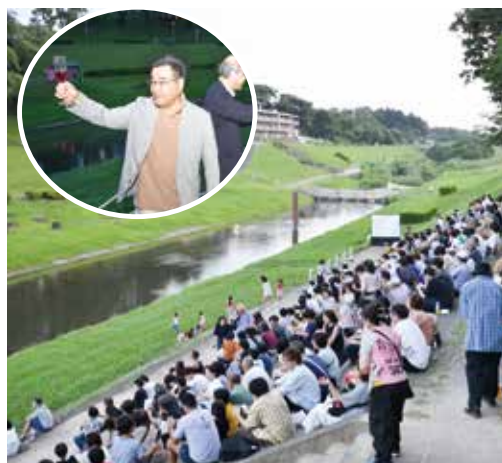
運河特設ステージで市長も乾杯

持続可能な水辺の活用に向け官民一体で活動する「ミズベリング」の環で7月7日、利根運河で一斉に乾杯するイベントが行われた。同実行委員会が、運河周辺の住民と東京理科大学生の交流を促そうと企画。出店が並び、学生の演奏なども行われ委員らは「コロナ禍を経た4年分の思いが詰まった乾杯が聞けてうれし」と話していた。