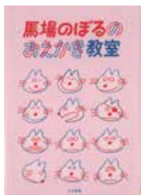
「馬場のぼるのおえかき教室」 馬場のぼる・作 こぐま社

江戸時代にまとめられた書物の挿絵の中に描かれた虫たちとは。かぶとの装飾のモチーフになった虫や蚊の撃退法など、江戸時代の虫と人との関わりを絵とともに百話紹介しています。