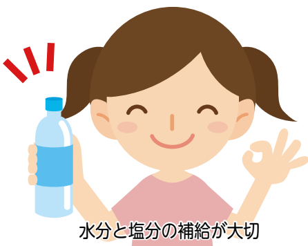
水分と塩分の補給が大切