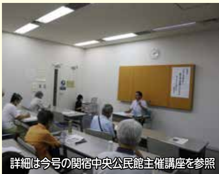
詳細は今号の閑宿中央公民館主催講座を参照