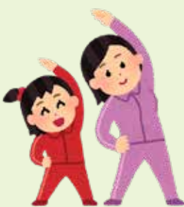
楽しく学んで健康を維持