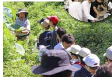
キノコやバッタを採集し実験室で観察

公民館主催で8月23日と24日に開催した。小中学生30人がキャンパス内の里山の自然の中で生物を採集し、研究で使う高性能の顕微鏡で観察する科学体験を楽しんでいた。