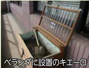
ベランダに設置のキエーロ