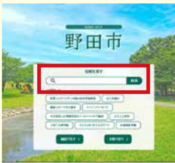
検索番号はページ中央に入力