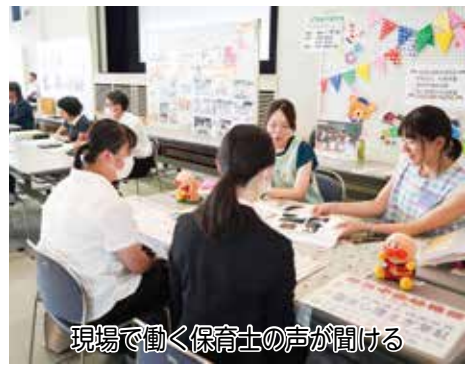
現場で働く保育士の声が聞ける