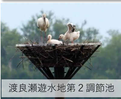
渡良瀬遊水地第2調節池