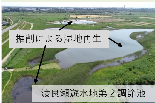
掘削による湿地再生