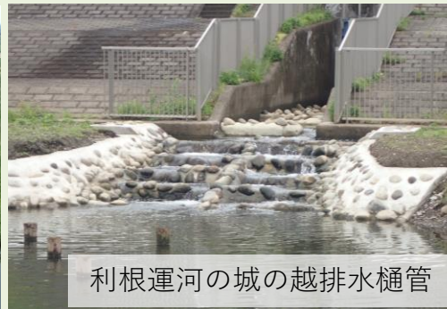
利根運河の城の越排水樋管