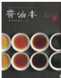
「醤油本」 高橋万太郎・著 玄光社

興風図書館 ☎ 7123-7611 南図書館 ☎ 7125-7981 北図書館 ☎ 7129-8811 せきやど図書館 ☎ 7198-4946