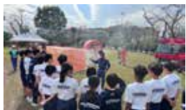
煙の中を避難する体験