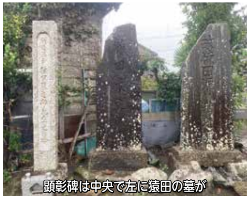
顕彰碑は中央で左に猿田の墓が