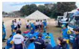
装備機材などの展示