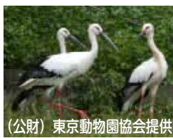
移送後のミライ (中央)