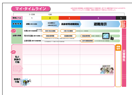
洪水ハザードマップに添付

洪水や浸水などの万一の災害に適切な行動ができるよう、マイ・タイムライン(個人ごとの防災行動計画)を作りましょう。