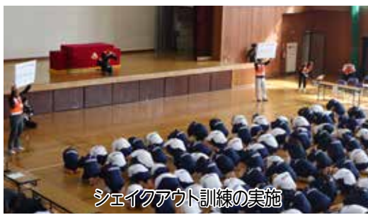
シェイクアウト訓練の実施