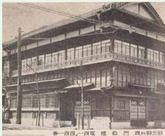
昭和初期の「野田町名所案内」に掲載される門松楼の写真