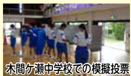
木間ヶ瀬中学校での模擬投票

市では、政治や選挙に関心を持ってもらうと市内中学校や高校で選挙出前授業を行っています。