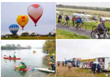
関宿滑空場を会場に空まつりも同時開催

健康スポーツ文化都市宣言と真誕生150周年を記念し、市では、11月26日に野田スカイスポーツ振興会、野田関宿カヌークラブ、野田市サイクリング協会と共に野田アウトドアスポーツフェスタ2023を開催した。キッチンカーも並ぶ中、2千人が熱気球体験やデモフライト、カヌー体験、自転車イベントなどを楽しんだ。