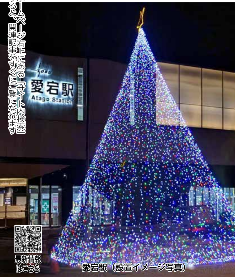
愛宕駅（設置イメージ写真）

【問合せ】愛宕駅は愛宕駅周辺地区市街地整備事務所☎④ 7189-7048、野田市駅は都市整備課☎④ 7123-1647