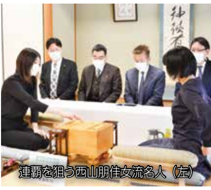
左(女流名人)友人山西を覇連

子どもたちに将棋の魅力に触れてもらおうと、女流名人戦前日の2月3日(土)に②「宝珠花小僧将棋まつり」を開催します。 【日時・場所】2月3日(土)13時～14時50分・関宿コミュニティ会館