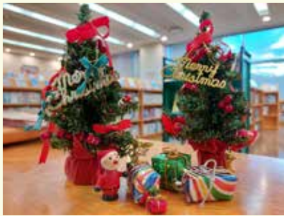
「こどものへや」はクリスマスの飾り付け