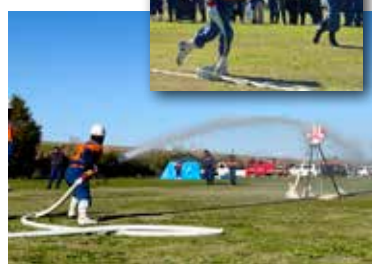
放水するまでの時間や正確さを競う

消防ポンプを用いた消火技術の正確さや時間を競う消防団消防操法大会が11月19日にスポーツ公園（木野崎）で開催され、ポンプ車の部に1チーム、小型ポンプの部に6チームが参加した。第1分団（野田のうち下町、上花輪のうち太子堂と第24分団1部尾崎、尾崎台）が最優秀賞を受賞し、令和6年6月30日に総合公園で行われる東葛飾支部消防操法大会に出場する予定。