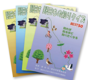
野田もの知りクイズ