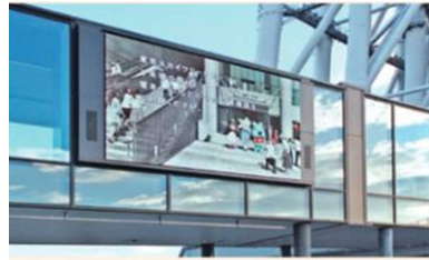
東京スカイツリー スカイアリーナ