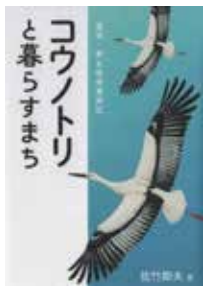
「コウノトリと暮らすまち」 佐竹節夫・著 農山漁村文協会

興風図書館 ☎ 7123-7611 南図書館 ☎ 7125-7981 北図書館 ☎ 7129-8811 せきやど図書館 ☎ 7198-4946