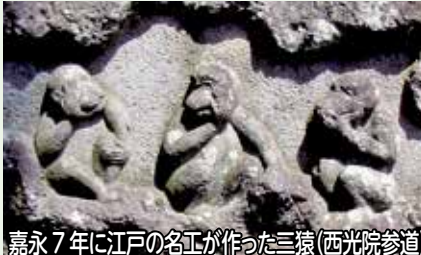
嘉永7年に江戸の名工が作った三猿（西光院参道）

野田市には853基の庚申塔が確認されており、ほかの地域に見られない野田独自のデザインの庚申塔がたくさんありますので、観察してみてください。