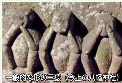
一般的な形の三猿（今上の八幡神社）

日光東照宮の「見ざる、言わざる、聞かざる」の三猿は、「悪いことを見てはいけない、言っははいけない、聞いてはいけない」という教えで有名ですが、これと、庚申信仰（庚申の夜は、眠ると体内から三尸 さんし という虫が天に昇り、日頃の罪を報告することから、庚申の夜は寝ないという中国の道教の教え）が結びついて、三猿が彫られたという説があります。