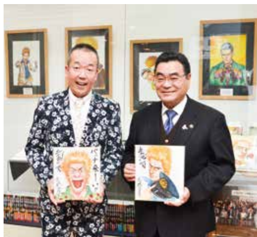
市長が持つ色紙をプレゼント(応募方法は4月1日号掲載)

による無意識の思い込み(アンコンシヤス・バイアス)と共に、地域や職場、家庭において男女差別を生む要因といわれています。 性別に関わる言葉を見つめ直すことで、ジェンダーバイアスは解消されることがあります。