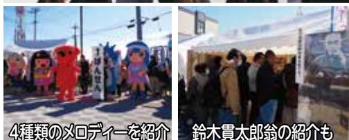
4種類のメロデーを紹介