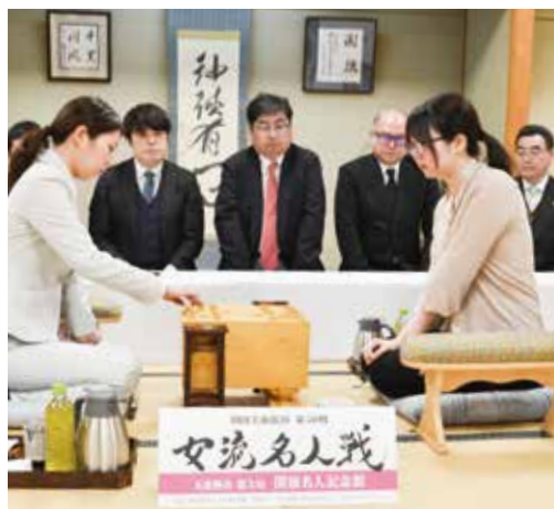
「歴史と趣ある記念館で対局できてうれしい」と西山名人(右)

将棋の岡田美術館杯女流名人戦五番勝負第3局が2月4日、関根名人記念館で開催され、西山朋佳女流名人が福岡香奈女流四冠に勝利し、通算1勝2敗とした。今年の大盤解説会は人数制限が解除され、市内や都内、大阪府などからファンが駆け付け満席に。「参加5回目だ枝豆、醤油と野田の名産に詳しくなりましたよ」と話す男性もいた。