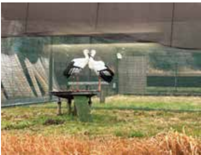
このとりの里で見学できるコウくとコウちゃん

【定員・参加費】 先着80人・200円 【申込みと問合せ】 3月5日(火)～15日(金)にみどりと水のまちづくり課自然保護係 ☎0471-99-8147へ 【HP検索】 1040600