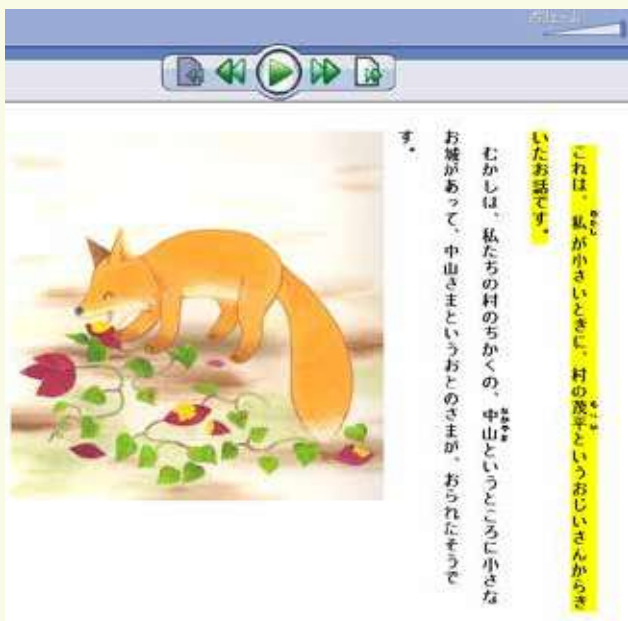
マルチメディアデイジーで読書しやすく