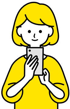
スマホでの意見提出も

【閲覧場所】各担当窓口、市役所・いちいのホールの行政資料コーナー、各公民館、各図書館、生涯学習センター(樺のホール内)や市ホームページ 【提出方法】所定の用紙が任意