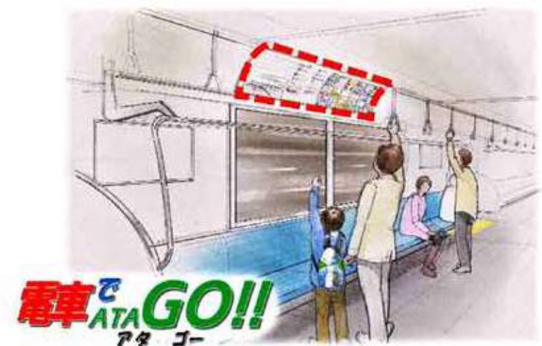
東武野田線(東武アーバンパークライン)車内にも

今年度も新たに30作品が仲間入りし、3年間で全90作品の駅前美術館が完成します。 駅前美術館完成記念として、令和5年1月14日(土)から1か月間、東武野田線(東武アーバンパークライン)全車両にて、新規30作品を紹介する企画「電車でATAGO!!!」でポスターを車内広告スペースに掲出します。