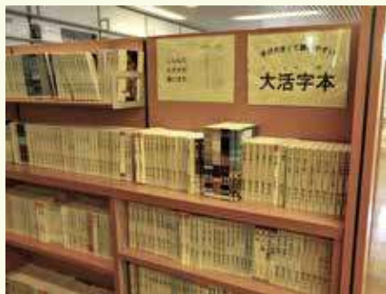
興風図書館の大活字本コーナー

エルエルとはスウェーデン語で「やさしくてわかりやすい」という意味の言葉の略です。 ＬＬブックは知的障がいのある方や文字を読んだり本の内容を理解するのが苦手な方でも、