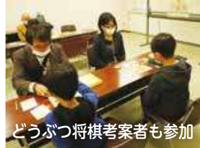
どうぶつ将棋考案者も参加

2月5日(日)の「第49期岡田美術館林女流名人戦五番勝負第3局」に合わせ、子どもたちに将棋の魅力に触れてもらおうと、前日の2月4日(土)に「宝珠花小僧将棋まつり」を関宿コミュニティ会館(いちいの