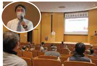
災害時のシュミレーション映像も紹介

コロナ禍で3年ぶりの開催となる中で、親子らは、市内の緑化活動に取り組みみどりのふるさとづくり実行委員会の指導のもと、稲わらの巻き付けなどに苦しみながら、好みの門松飾り一对を作っていた。