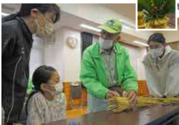
三ツ堀里山自然園内の材料を使用

三ツ堀里山自然園内の材料を使用し、小学生と保護者を対象に、親子で制作する「昔ながらの作り方で門松飾りを親子で制作」の講習会を開催した。