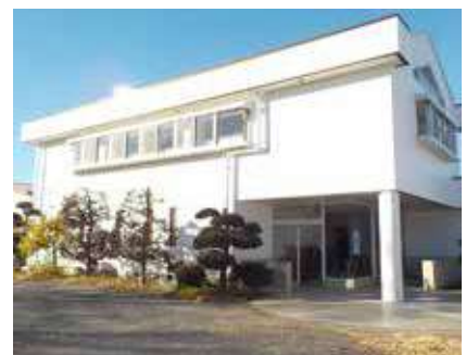
旧・船形中央会館をリニューアル

【申込み】直接同センター窓口(2月1日～3月31日)は直接市民生活課 ☎047123・1083へ 【HP検索】1036626