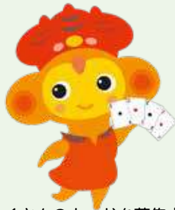
たくさんのカードを募集中

郷土博物館では、市民コレクション展の準備にあたり、カードコレクションをお持ちの方を募集しています。市民コレクション展とは、市民の方が収集したコレクション