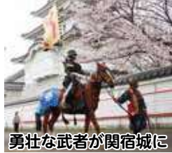
勇壮な武者が関宿城に

3月26日回から4月2日回まで県立関宿城博物館や関宿にこの水辺公園周辺で開催されます。