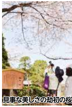
見事な美しきの初桜

さくら名所百選の清水公園では3月18日田から4月9日回まで、さくらまつりを開催します。園内はライトアップされ、鮮やかに咲き誇る約2千本の桜を昼夜を問わず楽しめます。