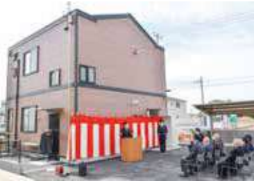
警察官が24時間365日常駐

新交番は、駅舎のイメージと合わせた外観が特徴で、市長は「昼夜を問わず駅前を見守っていたら、事件や事故が1件でも減ることを願っています」とあいさつした。