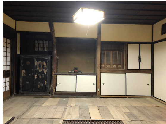
(2) 旧中村熊次郎商店主屋