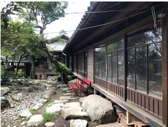
(3) 旧中村熊次郎商店書院