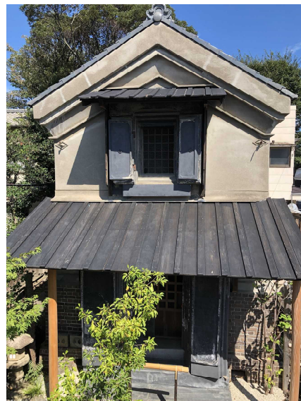
(4) 旧中村熊次郎商店煉瓦蔵