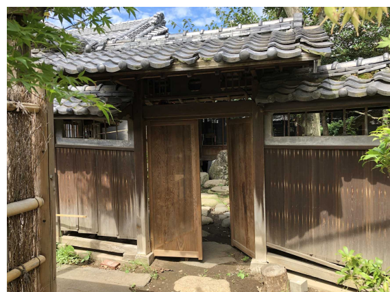
(6) 旧中村熊次郎商店中門・板塀