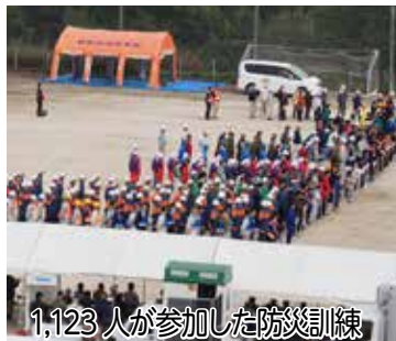
1,123人が参加した防災訓練