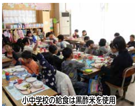
小中学校の給食は黒酢米を使用

007年に国土施策調査に採択され、翌年には「利根運河協議会」が設立されました。 現在は、さらなる取り組み強化のため「自然と人を育む地域づくり推進協議会」として新たな組織となり、利根運河を核とした利根運河エコパーク構想を継承し、自然・歴史・文化を体験できる回廊づくりを進めています。