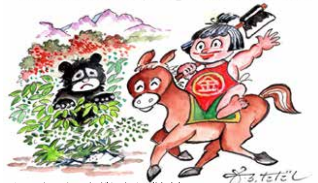
イラスト=もろただしさん (清水)