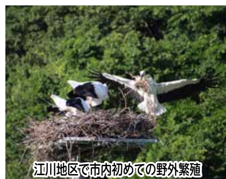
江川地区で市内初めての野外繁殖

平成27(2015)年に策定した「生物多様性の戦略」をさらに前進させるため、令和元年度から3年度にかけて見直しを実施しました。令和元(2019)年11月に市民、教育関係者、民間企業などを交えた市民会議を設立し、市民が望む自然環境を把握するためのアンケート調査や自然保護団体による自然環境調査(動植物の生息調査、江川地区の歴史調査など)を市内13か所で実施しました。この戦略の目標は、単なる自然保護にとどまらず、コウノトリをシンボルとした自然再生という野田市の特性を最大限に生かし、環境と経