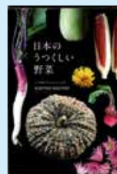
「日本のうつくしい野菜」 warmerwarmer・著 オレンジページ

日本在来の野菜や伝統野菜は現在、市場で流通する全体の1パーセントにも満たないといわれています。そんな絶滅寸前の野菜たちがたくさん写真で紹介されており、目で見て楽しめる1冊です。