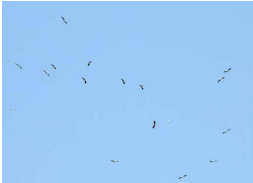
江川地区で10月にコウノトリが群れで舞う (撮影は三ヶ尾鷹渡り研究会の紺野竹夫さん)

市が出資する農業生産法人株式会社野田自然共生ファームが開発予定地を取得し、約90ヘクタールをビオトープ(生物生息空間)として再生しました。平成18