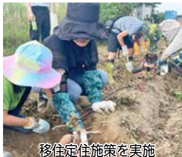
移住定住施策を実施

ンジで開催されました。クリス マスソングや野田市歌をハンド ベルで演奏し、多くの人ががすて きな音色に聴き入っていました。 【問合せ】①は興風図書館 ☎0471 23・7611、②は企画調整課