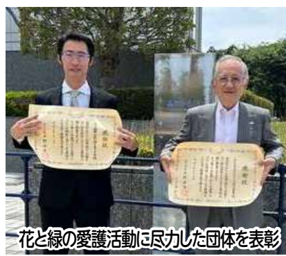
花と緑の愛護活動に尽力した団体を表彰

昨年6月に、「みどりのふるさとづくり実行委員会」と三ツ堀里山自然園を育てる会が国土交通大臣表彰を受賞したほか、9月に江川地区が環境省の自然共生サイトに認定されるなど、これまでの成果が表れつつあります。自然保護活動に少しでも興味のある方は、みどりと水のまちづくり課にご連絡ください。