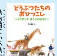
「どうぶつたちのおひっこし」 平山輝彦・著 福音館書店

興風図書館 ☎047123-7611 南図書館 ☎047125-7981 北図書館 ☎047129-8811 せきやど図書館 ☎047198-4946