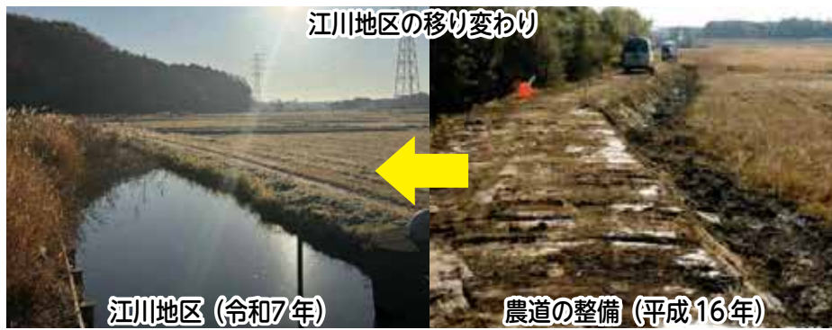
江川地区の移り変わり