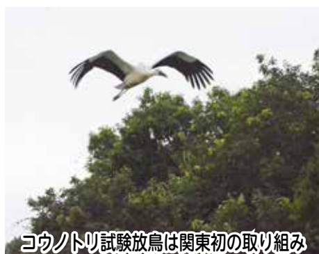
コウノトリ試験放鳥は関東初の取り組み

(2006)年には耕作放棄地を復田させ、20年からは水田型市民農園を開設しました。市民農園にはこれまで6千235人が参加し、減農薬の米作りを体験したほか、ホタルやメダカなど身近な生き物に触れる体験ができる自然観察会などにも参加しています。 将来的にはコウノトリが棲み続けられる環境づくりを目指し、減農薬栽培や冬水田といった活動を行っています。