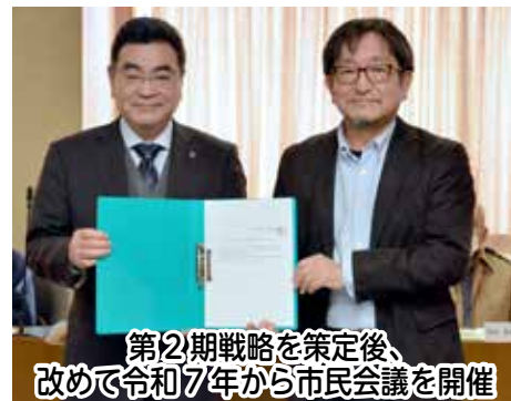
第12期戦略を策定後、 改めて令和7年から市民会議を開催

野外繁殖が目前にと報道され、野田のコウノトリが野外で活発に活動していることが報告されました。その後も継続的にヒナの誕生が報告され、放鳥後の見守り活動が続けられました。