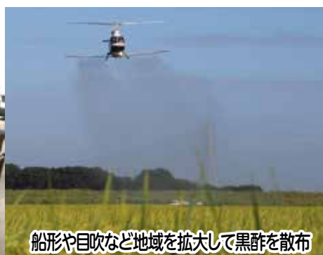
船形や目吹など地域を拡大して黒酢を散布

点に、単なる野生復帰にとどまらない、持続可能な自然再生事業を10年間にわたり進めてきました。 ●環境保全型農業とブランド化 コウノトリの餌場となる水田環境を守るため、コウノトリが敏感な農薬を極限まで減らし、代わりに玄米黒酢を水田に一斉散布する独自の農法を毎年実施しました。玄米黒酢は、カエルや