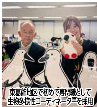
東葛飾地区で初めて専門職として 生物多様性コーディネーターを採用

「貴重な里山の環境を次の世代に」をテーマに、里山環境の保全を推進しました。令和6(2024)年1月には生物多様性コーディネーターを任命し、専門的な視点から事業推進体制を強化