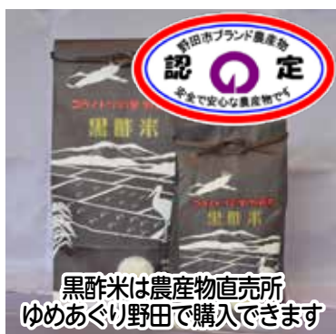
黒酢米は農産物直売所 ゆめあぐり野田で購入できます

この「黒酢米」はちばエコ農産物として認証され、保育所の給食にも採用される安心で安全なブランド米へと成長しました。