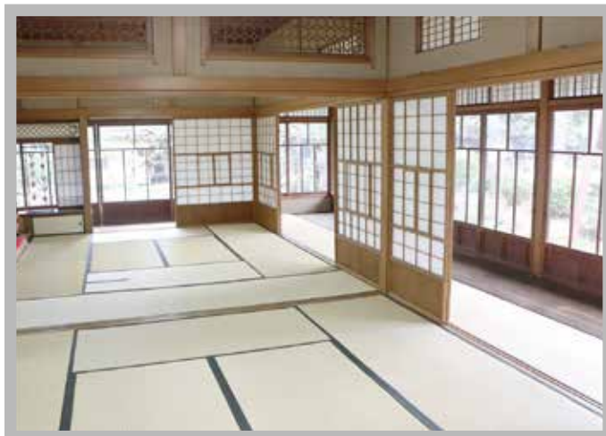
写真は野田市市民会館（旧茂木佐平治邸）松竹の間です。