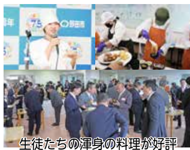
生徒たちの渾身の料理が好評

生徒たちは「レストランでは2年間の調理実習の成果を發揮し心に残るおいしい料理を作っていました」と決意を述べた。