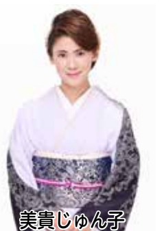
美貴じゅんじゅん

NHKからお知らせ：ご応募の際にいただいた情報は、抽選結果のご連絡、今回のイベントに関連した放送・コンテンツ配信事業のご案内、実施後の参加者アンケートのお願い、「受信料の窓口サイト」のご紹介のほか、受信契約者情報との照合、イベントに合わせた受信料に関するお問い合わせに利用させていただきます。なお、ご提供いただいた個人情報については、利用目的が達成され次第、遅滞なく消去いたします。NHKの個人情報の取り扱いについては、「一般分野プライバシーポリシー」および「NHKイベント・インフォメーションにおける個人情報保護について」をご確認ください。