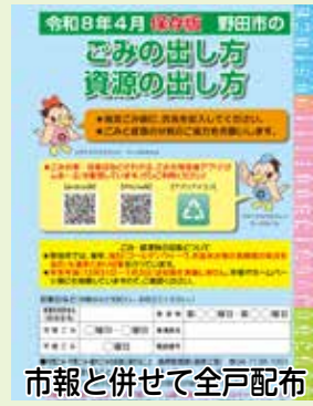
市報と併せて全戸配布

充電式電池の排出方法やみどりの収集受付で回収できないものなどをイラストや写真を増やし分かりやすく表記しました。また、指定ごみ袋の取扱店やごみ減量協力店、ごみ分別一覧内容も追加・修正をしています。