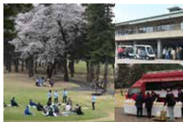
今年は野田コースで開催

350人を超える参加者は満開に咲く桜の下で、お花見やカート乗車のほか、株式会社日本一提供の焼き鳥セットや千葉カントリー倶楽部提供のお菓子を昼食に和やかな時間を過ごした。