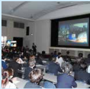
職員デジタル教育を実施

職員のデジタルスキル向上を目的とした研修を実施し、今後ノーコードツールによる申請手続のオンライン化や内部事務の