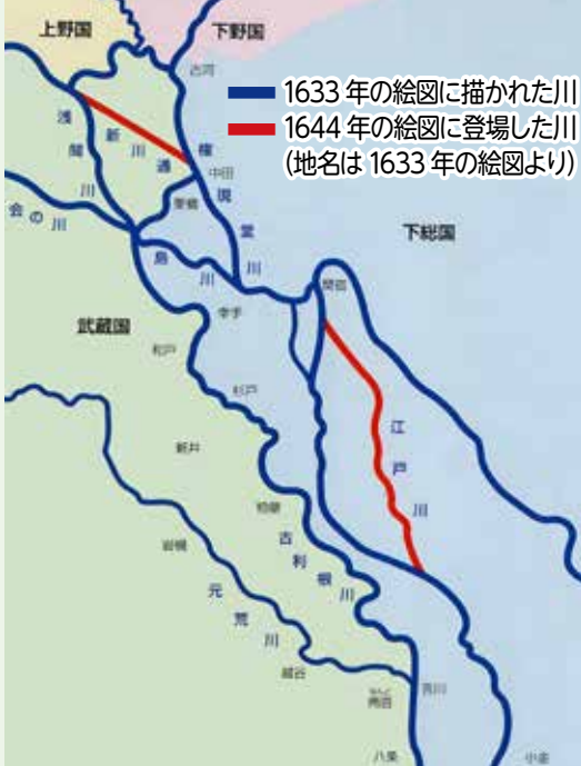
江戸川を掘った部分(「江戸川誕生物語」より転載)

【参考文献】郷土博物館「江戸川誕生物語」2002年、県立関宿城博物館「企画展図録利根川東遷と関宿藩」2006年、県立関宿城博物館「醤油を運んだ川の道～利根川・江戸川舟運盛衰」2012年、県立関宿城博物館「関東のへそ～地勢とくらしのヒストリー～」2020年