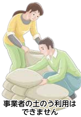
事業者の土のう利用はできません