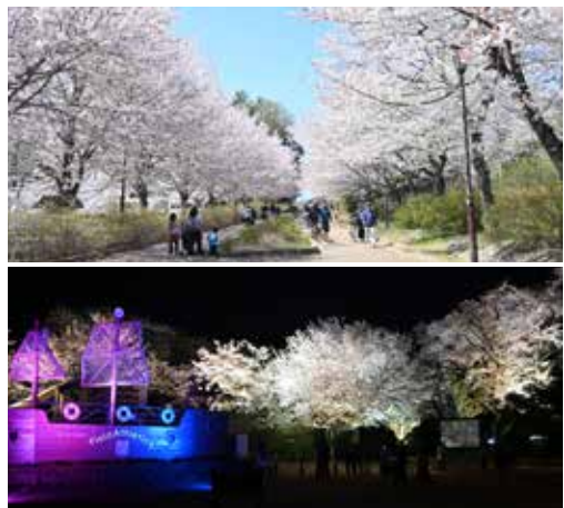
さくらまつりは23.5万人が来場で大盛況