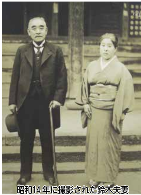
昭和14年に撮影された鈴木夫妻

市では、日本を終戦に導いた郷土の偉人、鈴木貫太郎翁の功績を伝えるとともに、全国に広めていく拠点として鈴木貫太郎記念館の再建に取り組