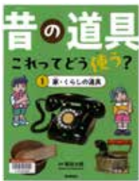
「昔の道具 これってどう使う?」 新田太郎・監修 Gakken

私たちの生活に欠かせない便利な道具。こういった身の周りのものは、昔どんな姿をしていたのでしょうか？今と昔のちがいを比べて、人々がどんな工夫をしてきたか学んでみませんか。