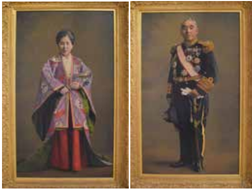
油彩画の大きさは各縦 112 センチ横 68 センチ