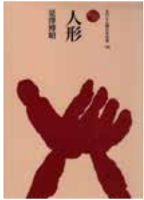
「人形」 是澤博昭・著 法政大学出版局

興風図書館 ☎ 7123-7611 南図書館 ☎ 7125-7981 北図書館 ☎ 7129-8811 せきやど図書館 ☎ 7198-4946